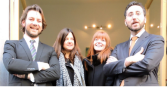
Studio Legale ROSSI & MARTIN