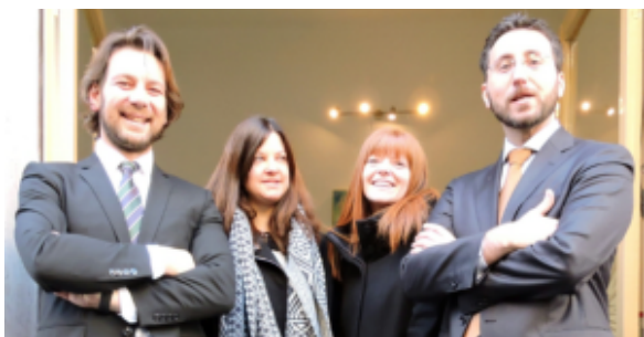
Studio Legale ROSSI & MARTIN