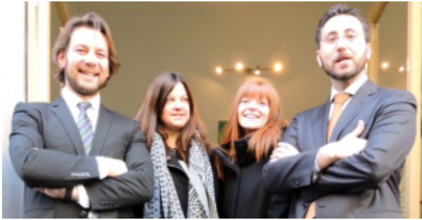
Studio Legale ROSSI & MARTIN

Livorno Pisa Arezzo Siena Grosseto Prato Trentino-Alto Adige Trento studio legale avvocato Bolzano Umbria Perugia studio legale avvocato Terni Valle d'Aosta Aosta avvocati Veneto Verona studio legale avvocato Vicenza Belluno Treviso Venezia Padova Rovigo